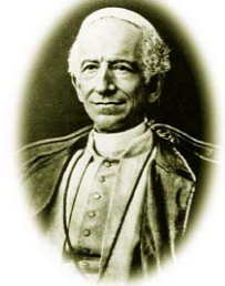
S.S. León XIII

El siglo XX significó para la Iglesia un tiempo de renovación y diálogo con su la realidad circundante. Pocos años antes de iniciarlo, León XIII publica la encíclica Providentissimus Deus (18/11/1893). La razón para hacerlo se hallaba en el desconcierto que los descubrimientos arqueológicos, la cuestión sobre la historicidad de los textos y el pensamiento crítico, habían causado en varios sectores de la Iglesia. En ella el Papa reitera las definiciones sobre inspiración contenidas en el Va-