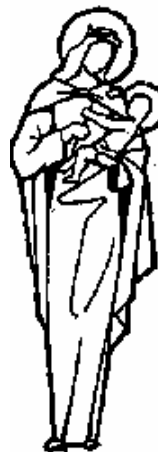
¡Oh María! ¡Ruega por nosotros!

Actividades: 1. Discute con tus compañeros el contenido del documento "La Interpretación de la Biblia en la Iglesia". ¿Entiendes de qué se trata? ¿Qué palabras te parecen complicadas? ¿Cuáles conceptos no te son familiares? Consulta las dudas con tu facilitador.