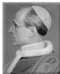
S.S. Pío XII

tu Santo; más aún, fueron escritos y editados por él mismo; sin poner en duda, por otra parte, que cada uno de los autores, según la naturaleza e ingenio de cada cual, haya colaborado libremente con la inspiración de Dios". Dice también que la Biblia "son palabras de Dios y no suyas (del autor), y lo que por boca de ellos dice, lo habla Dios como por instrumentos". Sobre los métodos, reitera la necesidad de mantenerse fiel a las directrices del Magisterio para no naufragar en los esfuerzos de explicar o defender la Sagrada Escritura a la luz de los progresos científicos.